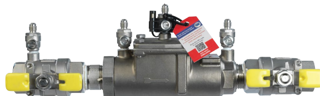
SS007QT avec capteur de gel

Les spécifications des produits Watts en unités coutumières américaines et métriques sont approximatives et ne sont fournies qu'à titre de référence. Pour des mesures précises, veuillez communiquer avec le service technique de Watts. Watts se réserve le droit de changer ou de modifier la conception, la construction, les spécifications ou les matériaux des produits sans préavis et sans encourir aucune obligation de procéder à de tels changements et modifications sur les produits Watts vendus antérieurement ou ultérieurement.